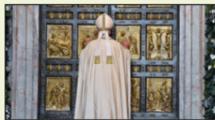
APRIAMO LA PORTA SANTA DELLA MISSIONE